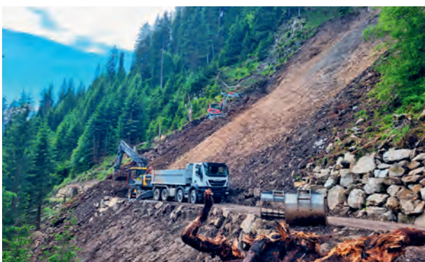
Sanierung der Rutschung bei der Forststrasse Ettlismatt – Eggbrunnen

Neben den Arbeiten für den Wasserbau, die Lawinenverbauung Matthorn und den laufenden kleineren Arbeiten für Dritte konnten im Betriebsjahr 2024 sehr umfassende Arbeiten für die Hochwasserschutzprojekte in Alpnach ausgeführt werden. Im Projekt Neubau Ettlismatt – Eggbrunnenstrasse musste vor dem eigentlichen Vortrieb des Strassenneubaus, der im Winter 2023 abgegangene Rutsch beseitigt und saniert werden. Diese ausserordentlichen Arbeiten haben die personellen Ressourcen derart gebunden, dass trotz einer üblichen gesamthaft produktiven Stundenleistung des Forstbetriebes deutlich weniger Holz genutzt werden konnte.