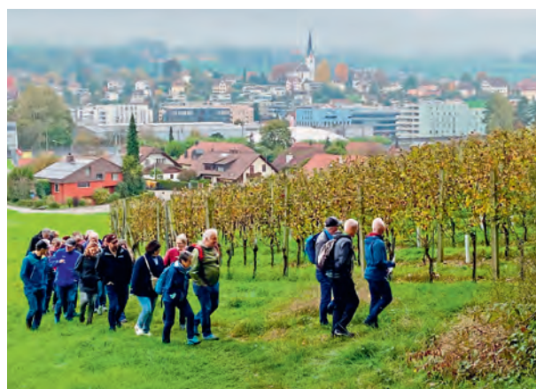
Ausflug der Kommissionen in den Rebberg der Ortsbürger- gemeinde Muri

Als Dankeschön für die Kommissionsarbeiten werden die Mitglieder aller ständigen Kommissionen alle zwei Jahre zu einem Ausflug eingeladen. Am 19. Oktober führte die Reise zur Umweltarena Spreitenbach und in den Rebberg der Ortsbürgergemeinde Muri AG.