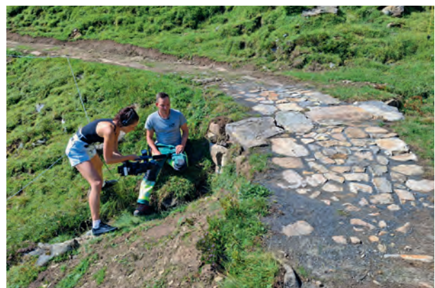
Reportageaufnahmen durch Tele1 bei den Sanierungsarbeiten der «Tremola en miniature».

Im Sommer konnten die Sanierungsarbeiten beim historischen Verkehrsweg «Tremola en miniature» gestartet werden. Die Arbeiten wurden fachgerecht durch die Firma Markus Enz GmbH, Giswil ausgeführt. Leider musste der Projektabschluss im Oktober infolge sehr schlechter Witterung auf Frühling 2025 verschoben werden. Das spezielle Projekt fand grosse Resonanz und wurde in mehreren Presseberichten und mit einer Tele1-Reportage dokumentiert.