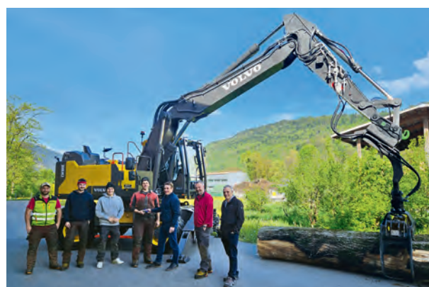
Ersatzanschaffung Pneubagger Volvo

Im Forstbetrieb konnte der Pneubagger Volvo EW 180 für CHF 305'000.00 ersetzt werden.