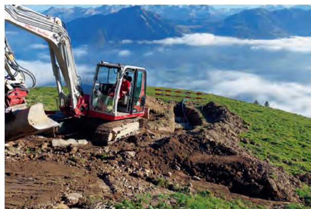
Grabenarbeiten für Wasserversorgung und Verstromung Ämsigen – Chretzenalp