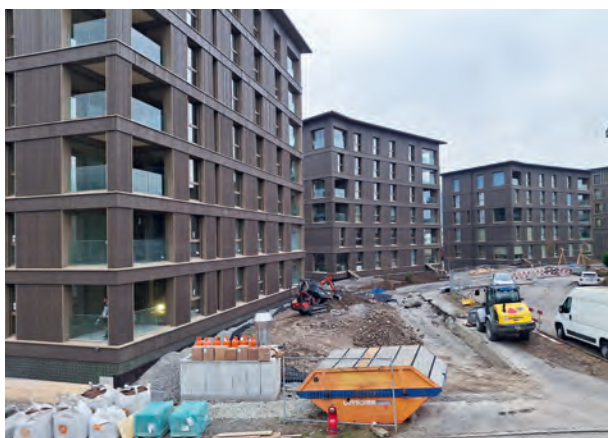
Entwicklung auf Baustelle «Überbauung Allmendweg 6, 8 und 10» (Stand: 17.2.2025)

Verkaufserlöse bzw. die Anzahlungen der Stockwerk-käufer sind für das Mehrfamilienhaus Allmendweg 6 mit Übergang von Schaden/Nutzen per 1. November 2024 verbucht worden. Aus diesen Verkäufen resultiert eine Gewinnverbuchung in die Erfolgsrechnung von 2,955 Mio. Franken. Per 1. Januar 2025 werden dann die An- und Schlusszahlungen für das Mehrfamilienhaus Allmendweg 8 passiviert bzw. der Gewinn verbucht.