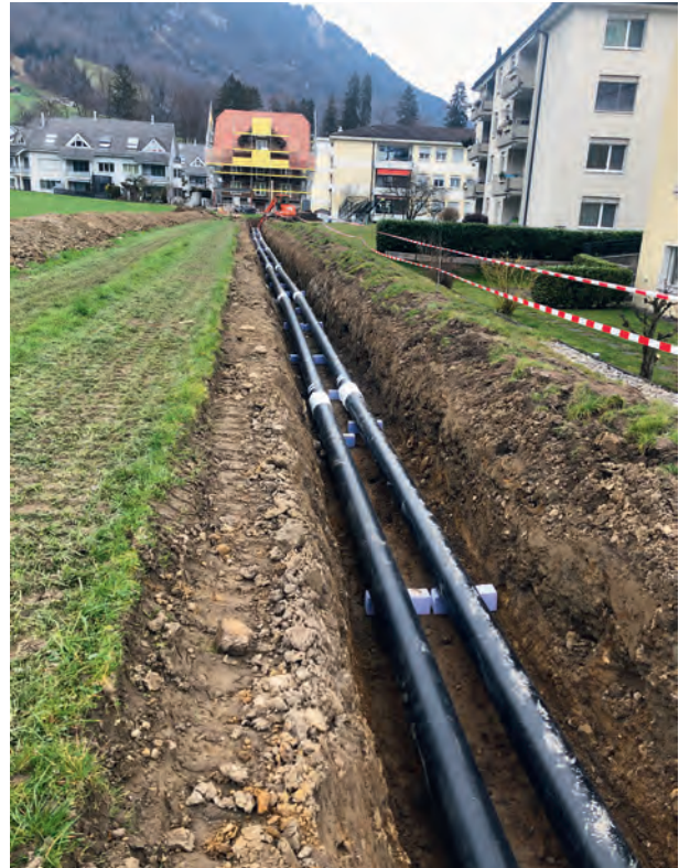
Fernwärmeleitungsbau im Gebiet Sonnmatt