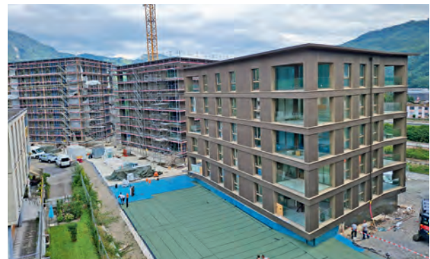
Überbauung Allmendweg 6, 8 und 10 (Stand: 19.08.2024)

Zudem stand im vergangenen Geschäftsjahr der Bauabschluss der drei Mehrfamilienhäuser Allmendweg 6, 8 und 10 im Fokus. Der Baufortschritt entwickelte sich gemäss Terminplan. Der Bezug der Eigentumswohnungen konnte gestaffelt per 1. November 2024 und 1. Januar 2025 vollzogen werden. Ab Herbst 2024 wurde die Vermietung der Wohnungen im Mehrfamilienhaus Allmendweg 10 gestartet. Es konnten alle Mietwohnungen vergeben werden (Stand: Ende Januar 2025).