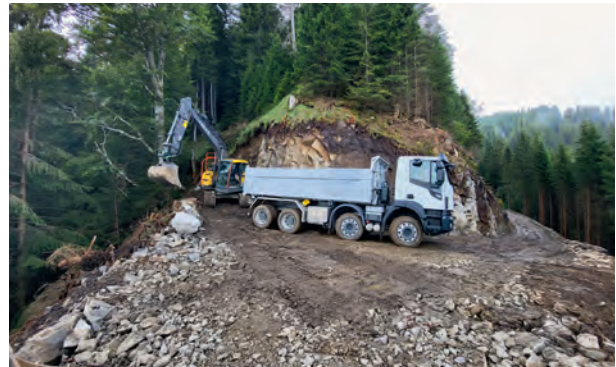
Realisierte 5. Etappe Forststrasse Ettlismatt – Eggbrunnen

Ab Mitte August konnte mit dem eigentlichen Vortrieb der 5. Etappe gestartet werden. Diese Etappe wurde im steilsten und bautechnisch schwierigsten Bereich des gesamten Strassenprojektes erstellt. Das Gelände lies keine Böschungsschüttungen zu und somit musste das ganze Strassen-Trasse in einem Vol্লাusbruch ins Gelände gelegt werden. Da der Baugrund fast ausschliesslich aus Felsen bestand, wurde ein Bagger-Abbruchhammer zugemietet. Im 2024 wurden rund 120 Laufmeter neue Strasse erstellt.